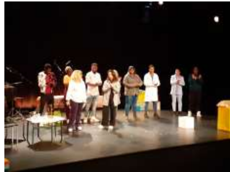
La soirée Citoyens du Monde : à la fois la soirée de la MCM64 et la soirée du clôturé du Festisol.