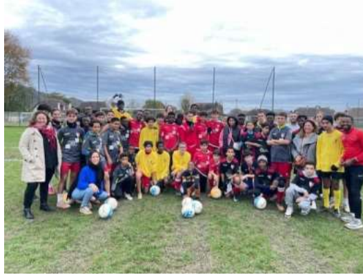
Un tournoi de football solidaire avec l'ASL Billère, les Citoyens Jardiniers d'Este, le Lacaoü, le Saaje, Ajir et Humanité solidaire.