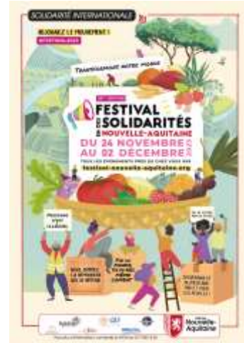
Des événements de lancement à la halle bio de Billère et aux halles de Pau.