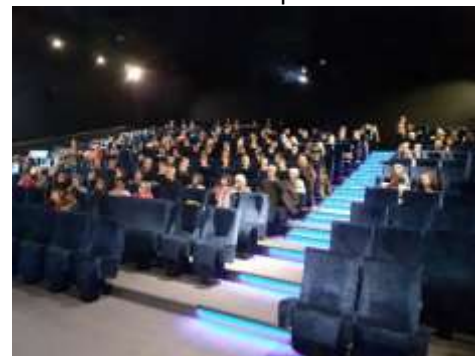
Une soirée débat au Méliès, en partenariat avec la Cimade, le Festival Migrant'scène et l'OGFA.