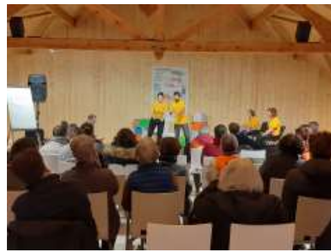
Produire et manger sain : un droit ? un luxe ? Journée organisée par le CCFD-Terre Solidaire à Emmaüs.