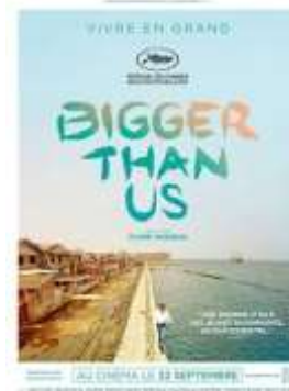
Une journée sur l'engagement animé par Osons Ici et Maintenant à la médiathèque André Labarrère.